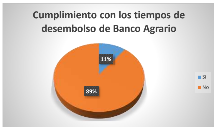
Gráfico 4. Cumplimiento con los tiempos de desembolso del Banco Agrario.