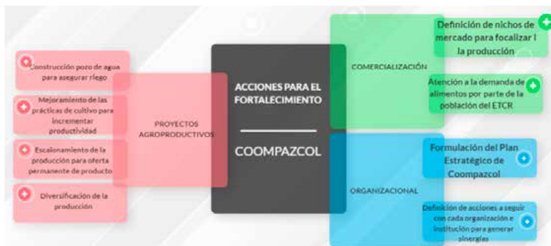
Figura 2. Acciones para el fortalecimiento organizacional de Coompazcol

sus integrantes y el relacionamiento con diferentes organizaciones, tanto públicas como privadas, condiciones que genera las bases para el trabajo y la proyección de la organización. El diagnóstico realizado permitió identificar las acciones para el fortalecimiento de Coompazcol, en los procesos productivos agrícolas, de comercialización y gestión (figura 2).