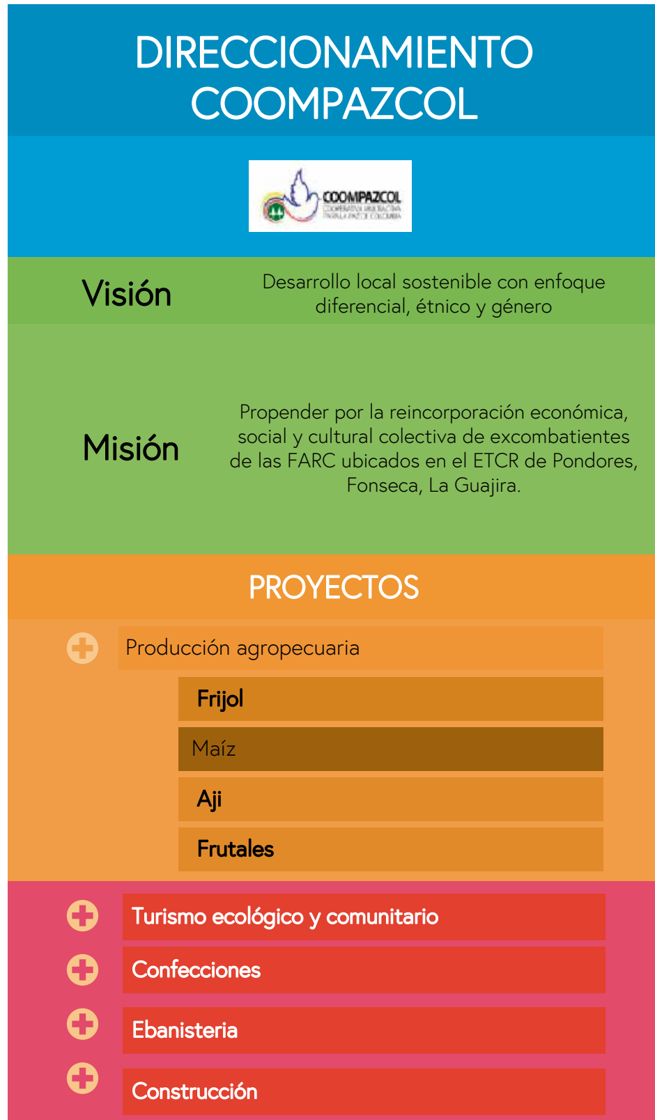
Figura 1. Direccionamiento estratégico y proyectos productivos de Coompazcol