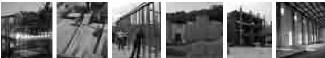
F - 14