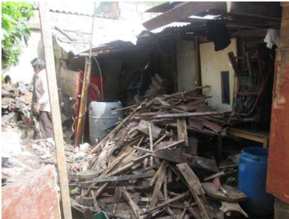
Tomada en la localidad de Fontibón 2 , (fuente: por el autor octubre 2013)

Seguidamente, se determina por las condiciones geográficas, estas condiciones no permiten que se realice algún tipo de adecuación y responde por ejemplo a la ubicación de los predios donde se presentan fallas geológicas. Finalmente las de carácter legal, aquí se estipula acerca del uso y destinación de la tierra, los cuales son determinados por los parámetros legales y establecidos por los entes territoriales en sus planes de ordenamiento territorial.