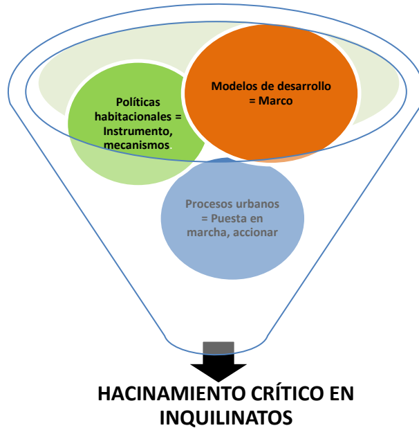
Figura 6

En la figura 6, se representan tres (3) supuestos