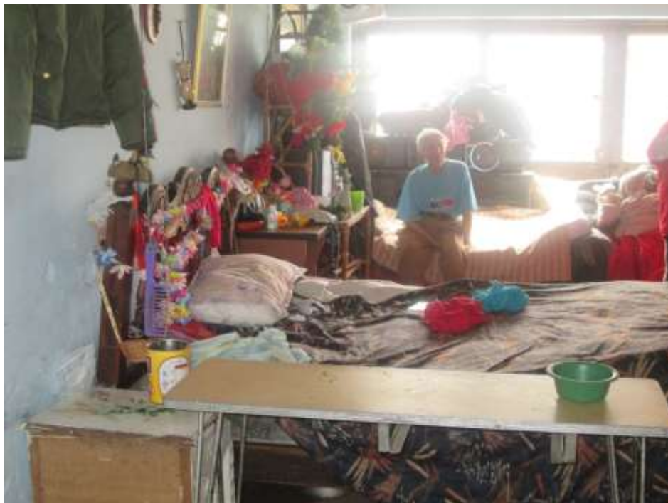
Figura 3. Personas hacinadas en una habitación

Tomada en la localidad de Fontibón, allí conviven 6 personas