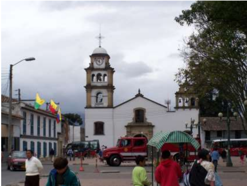
Figura 2. Parque Central de Fontibón

Parque central de Fontibón (Fuente http://www.panoramio.com/photo . Fecha consulta agosto 2013 )