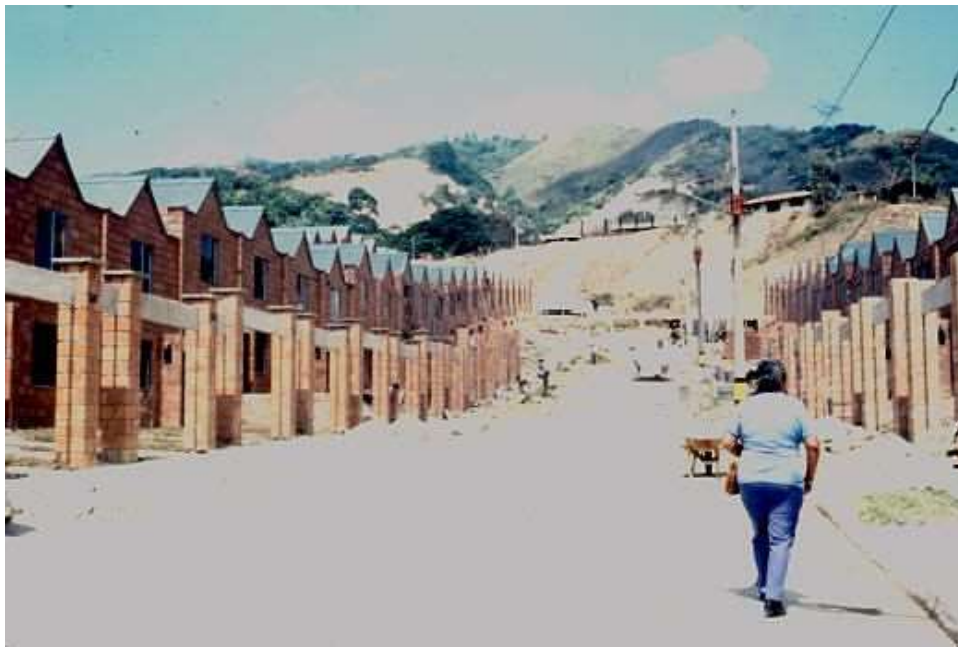
Figura 5. Construcción de Vivienda nueva en la periferia