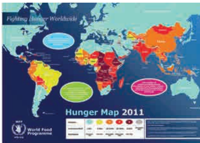
Figura 5. Mapa del hambre en el Mundo