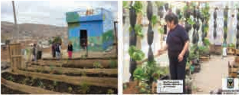
Figura 9. Agricultura urbana en zonas marginales de Bogotá

En Colombia se han dado grandes pasos en el fortalecimiento de la agricultura urbana para empoderar a comunidades vulnerables, lograr su sostenibilidad alimenticia y reducir la dependencia de la agricultura intensiva. El programa de Acción Social de la Presidencia de la República, mediante la Red de Seguridad Alimentaria (ReSA), busca generar en las comunidades un cambio de actitud, estableciendo unidades de producción para el autoconsumo, aprovechando el conocimiento propio de las poblaciones rurales y urbanas que han estado en contacto con la tierra y conocen cómo trabajarla de manera sostenible. El Programa ReSa cuenta con 4 líneas de intervención: ReSA Rural, ReSA Urbano, ReSA Culinaria Nativa y ReSA Maíz y Fríjol. Desde su origen, y hasta la fecha, ReSA ha implementado 447 proyectos en los 32 departamentos, 1007 municipios, mejorando las condiciones de seguridad alimentaria de 915.516 familias (ReSA, 2010).