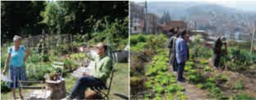
Figura 4. Allotment Gardens en Europa y agricultura urbana en barrios marginales