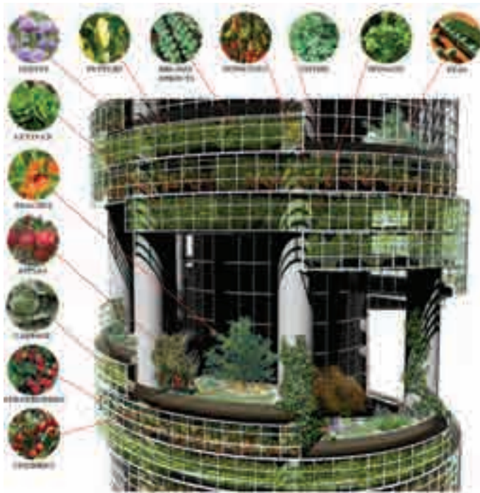
Figura 6. Proyecto Vertical Village, Estudio MRVDV + The Why Factory. Department at TU Delft