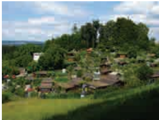
Figura 7. Huertas familiares o allotment gardens in Käferberg, Zurich (Suiza)

Estas huertas familiares han sido una estrategia importante de seguridad alimentaria; por ejemplo, en las dos guerras mundiales, estas huertas proporcionaron muchos de los alimentos que las ciudades asediadas por la guerra necesitaban para su sobrevivencia, y que no podían obtener por estar continuamente aisladas de los territorios agrícolas donde tradicionalmente obtenían sus recursos alimenticios, debido a las actividades bélicas en las zonas rurales. La importancia de estas huertas familiares fue de tal magnitud que un año después de la Segunda Guerra Mundial, en 1919, se aprobó en Alemania la primera ley que las protegía (Small Garden and Small Rent Land Law). En 1983 esta Ley fue modificada por la Ley Federal de Huertas Comunitarias ( Bundeskleingartengesetz , BkleinG, 2146, 2006). En la actualidad existen más de 1,4 millones de huertas familiares solo en Alemania, los cuales cubren una superficie de 470 km 2 . En Europa estos allotment gardens se han convertido en una oportunidad para la recreación familiar a través del cultivo como herramienta de descanso y relajación de las actividades cotidianas, y un escape de fin de semana para las personas que quieren entrar en contacto con la naturaleza a través de la agricultura y jardinería urbana (figura 7).