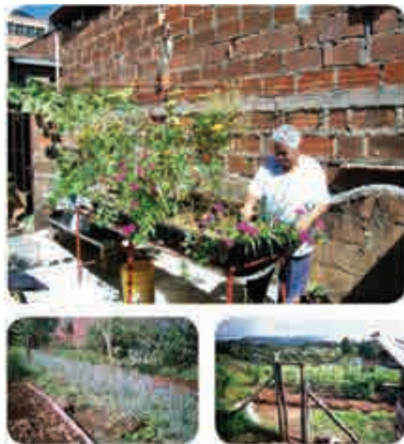
Figura 10. Agricultura urbana en terrazas y lotes baldíos en Bogotá

El Instituto Humboldt también ha sido un actor importante nacional e internacional en el desarrollo de una sostenibilidad ambiental, proporcionando recursos y capacitación técnica a las comunidades vulnerables. Actualmente ha desarrollado en Bogotá la coordinación de los programas de ReSA, de Acción Social, con resultados sobresalientes en la transformación de barrios y comunidades mediante los programas de educación ambiental y agricultura urbana. También fue importante el esfuerzo de la administración del alcalde Lucho Garzón mediante el programa "Bogotá sin Hambre", el cual buscaba remediar las deficiencias alimenticias de las poblaciones vulnerables mediante programas de comedores comunitarios, asociados con cadenas de producción agrícola urbana en las zonas de Ciudad Bolívar y Usme.