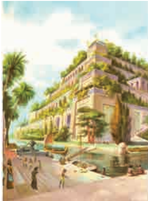
Figura 1. Jardines Colgantes de Babilonia, Irak (600 a. C.)

Ganges nos han dejado las huellas de aquellos primeros intentos (algunos de sorprendente creatividad) (figuras 1 y 2) de organizar la sociedad en una ciudad. Estas primeras ciudades reflejaban de alguna manera las estructuras sociales propias de los humanos, y pasaron de ser simples refugios improvisados, a ser verdaderos ejemplos de relación armónica con la naturaleza. Ahora bien: esta primera condición de asentamiento no puede separarse de otro grande descubrimiento humano: la agricultura. Fue quizás primero el descubrimiento de poder cultivar alimentos el que llevó al ser humano a tomar la difícil decisión de asentarse permanentemente en un lugar, sabiendo a través de la evolución, que la sobrevivencia estaba asociada al continuo movimiento de estos primeros pobladores, de valle en valle y de región en región, descubriendo continuamente nuevos escenarios, maravillados de ser los únicos miembros de su especie en recorrer la amplitud del vasto mundo.