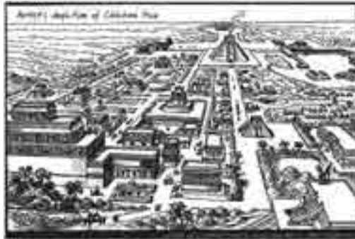
Figura 2. Reconstrucción gráfica de Chichen Itza, México (525 d. C.)