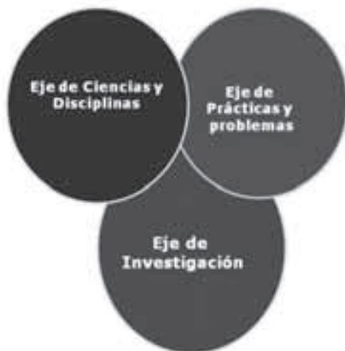
Figura 1. Ejes curriculares.

Por lo anterior, la Maestría en Filosofía entiende que estos ejes curriculares están entrelazados entre sí, de manera que son interdependientes: