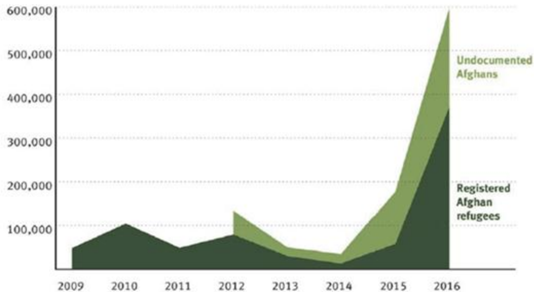
Figura 3. Retorno de refugiados afganos desde Pakistán 2009-2016 Fuente: HRW (2016).

El análisis de la implementación y la evaluación de la Estrategia de Protección de Pakistán es realizado con base en el entorno contextual de 2015-2016, y comprende dos apreciaciones; por un lado, se consideran los reportes de ACNUR con respecto a la situación de los refugiados y su repatriación masiva (ver Figura 3 y Anexo 2) y por el otro se examinan los factores que han promovido dicha dinámica dentro del periodo señalado.