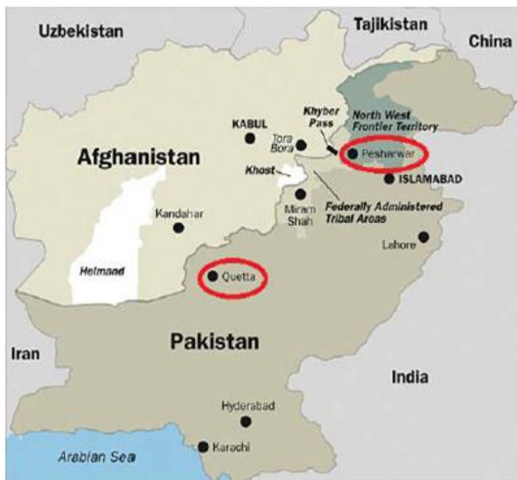
Figura 1. Frontera Afganistán – Pakistán

Los afganos que entraron a Pakistán se ajustaban a la definición de refugiado establecida en la Convención de 1951 y Protocolo de 1967 puesto que huían de un conflicto interno que atentaba directamente sobre su seguridad, y aunque Pakistán no era signatario de estos tratados, decidió extender su reconocimiento hacia los afganos como refugiados y solicitó asistencia internacional que se materializó con la apertura de la oficina de ACNUR en Islamabad (Khattak, 2003). Este tipo de decisiones trajo consecuencias directas para la vida de los refugiados afganos, en tanto que, en primer momento tuvieron privilegios por las relaciones que Pakistán mantenía con occidente, y posteriormente inconvenientes conforme al cambio de objetivos, interés nacional y la dinámica regional.