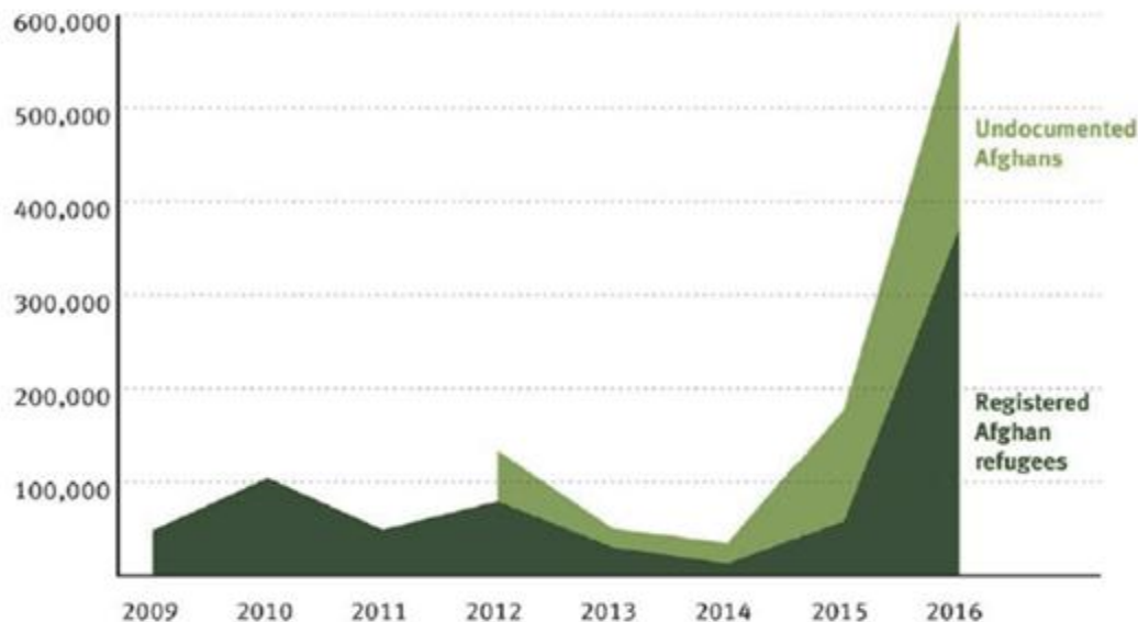
Figura 3. Retorno de refugiados afganos desde Pakistán 2009-2016

El análisis de la implementación y la evaluación de la Estrategia de Protección de Pakistán es realizado con base en el entorno contextual de 2015-2016, y comprende dos apreciaciones; por un lado, se consideran los reportes de ACNUR con respecto a la situación de los refugiados y su repatriación masiva (ver Figura 3 y Anexo 2) y por el otro se examinan los factores que han promovido dicha dinámica dentro del periodo señalado.