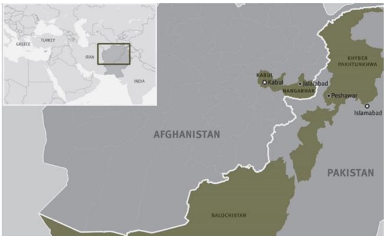
Figura 5. Provincias fronterizas donde vive la mayoría de refugiados afganos y los repatriados

El cambio trascendental comenzó en el año 2015 cuando Pakistán repentinamente fijó plazos más cortos que los anteriores para que se llevara a cabo el éxodo de los refugiados, tomando medidas como el cierre del principal cruce fronterizo en Torkham -conecta la provincia de Nangarhar con Khyber- (ver Figura 5) (Khan, 2016). Con esto, se denotaron prohibiciones de regreso de aquellos afganos que habían salido temporalmente de Pakistán y se impusieron condiciones para que la salida del territorio pakistaní fuera definitiva.