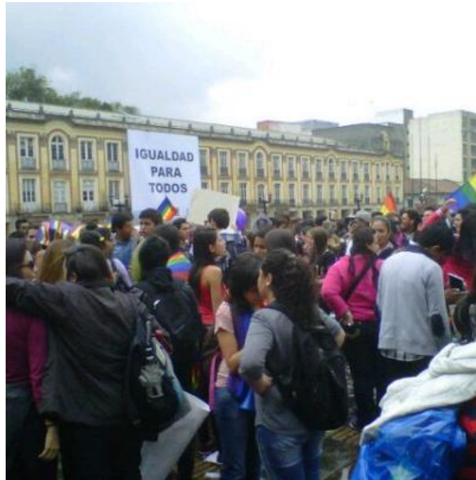
23 de Abril 2013 Plaza Bolívar Imagen de archivo

Colombia sigue siendo un país excluyente en el cual existen procesos de marginación y exclusión social Garay (2002), sin embargo, se han presentado algunos avances en la legislación nacional y en procesos locales como la materialización de la política pública en Bogotá para asuntos LGBTI, que abre paso a diferentes colectivos y movimientos sociales que aportan a los procesos de restablecimiento y visibilización de los colectivos denominados como minorías LGBT. Sin embargo, los logros aun no son suficientes para garantizar los derechos de los ciudadanos que pertenecen a grupos diversos.