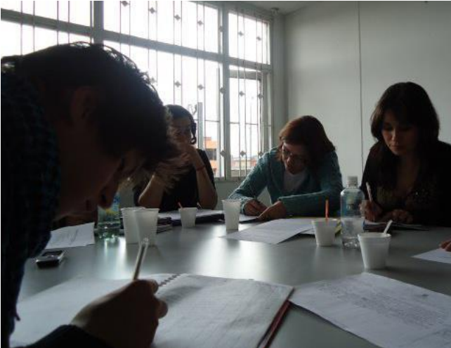
Mesa LGBT Rafael Uribe Uribe Imagen de archivo

dedicación intensa a una determinada línea de acción en la vida pública, bajo estas claridades se presenta la Mesa LGBT.