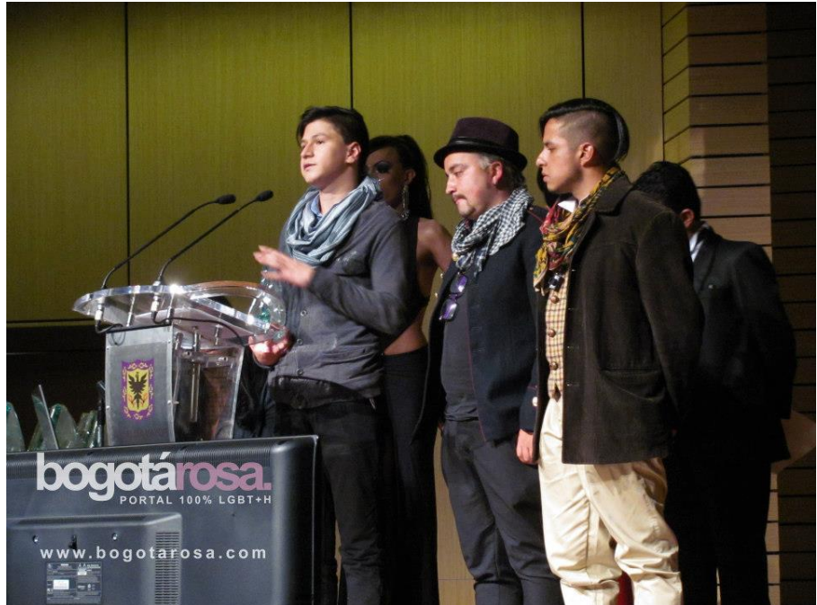
Galardón león Zuleta 2012 Imagen de archivo

A continuación se presentan las narrativas de las personas que participaron en el grupo focal sobre el matrimonio igualitario, se ha aplicado la técnica patchwork y se decide marcar el número según el seudónimo de cada integrante del grupo, de esta manera se encuentran organizadas en cuatro categorías.