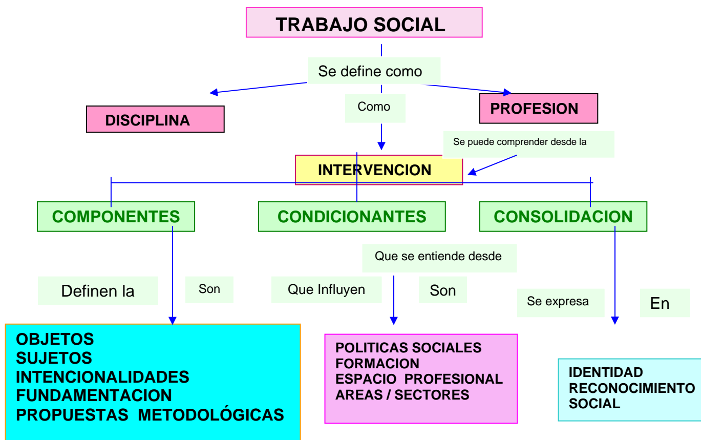
Esquema 1. Mapa Conceptual Para Leer La Intervención profesional De Trabajo Social 77