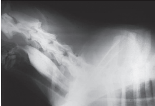
Figura 2. Radiografía latero-lateral de cuello con medio de contraste. Se observa retención de bario y reflujo del mismo hacia la laringe y la faringe, en el caso 2.

Debido a complicaciones del proceso neumónico y a que se trataba de un animal callejero, sin un propietario que se hiciera cargo de los costos de su tratamiento, se realizó eutanasia con pentobarbital (Euthanex®, laboratorio Intervet).