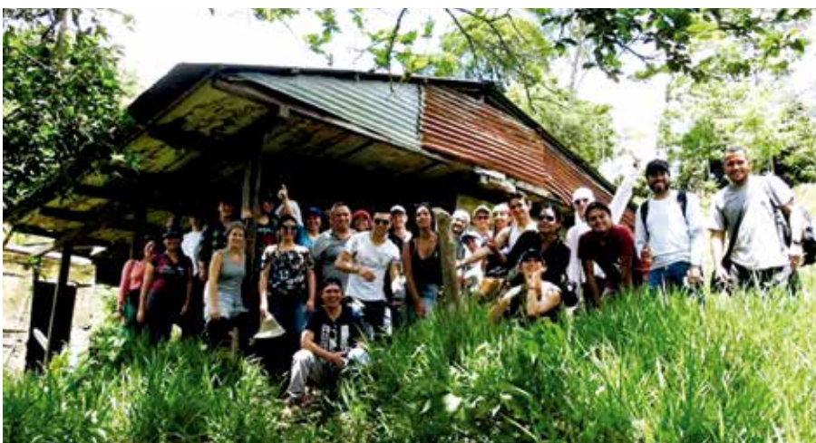
Workshop Sustainable Urbanism (Taller de urbanismo sostenible) 2018, Monterrey, Casanare.