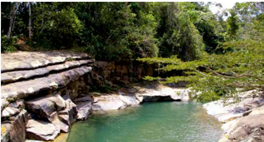
Piscinas del Güejar, Lejanías, Meta.