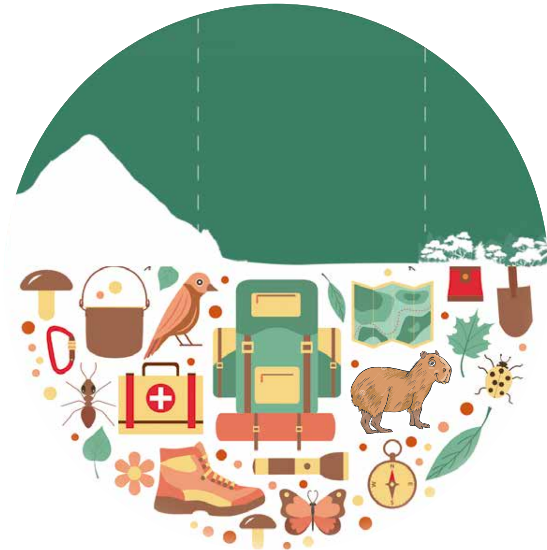
Representación del ecoturismo en el Piedemonte - Llano - Selva.

necesaria a la hora de hablar de paz. Esta reconciliación solo es posible siempre y cuando, todos los colombianos tengamos la disposición para reconocernos en esos territorios, otrora habitados por seres humanos supuestamente distantes y violentos que, no obstante, ahora están dispuestos a compartir y ofrecer sus conocimientos sobre infinidad de lugares sorprendentes.