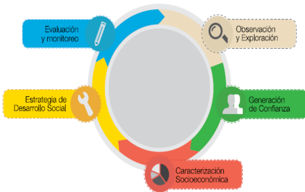
Grafico2. Proceso de intervención social integral

En su funcionamiento diario, la Fundación Carvajal direcciona toda su capacidad operativa, de gestión, permitiendo su ajuste y adaptación a las características particulares de las comunidades y/o grupos sociales de interés en función del desarrollo social y comunitario, buscando siempre acompañar a las comunidades más vulnerables mejorando así su calidad de vida a todo los niveles individual, familiar y comunitario.