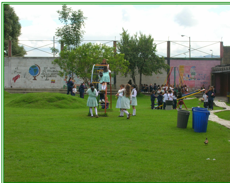
Foto 7. Momento de recreación niñas de Preescolar, Gimnasio del Corazón de María