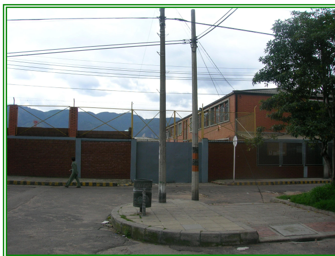
Foto 5. Entrada principal Gimnasio del Corazón de María, carrera 46 No. 73-24

En 1961 se inicia el bachillerato y se proyecta la construcción del edificio actual ubicado en la carrera 46 N°. 73-24 en Santafé de Bogotá, en el Barrio San Fernando.