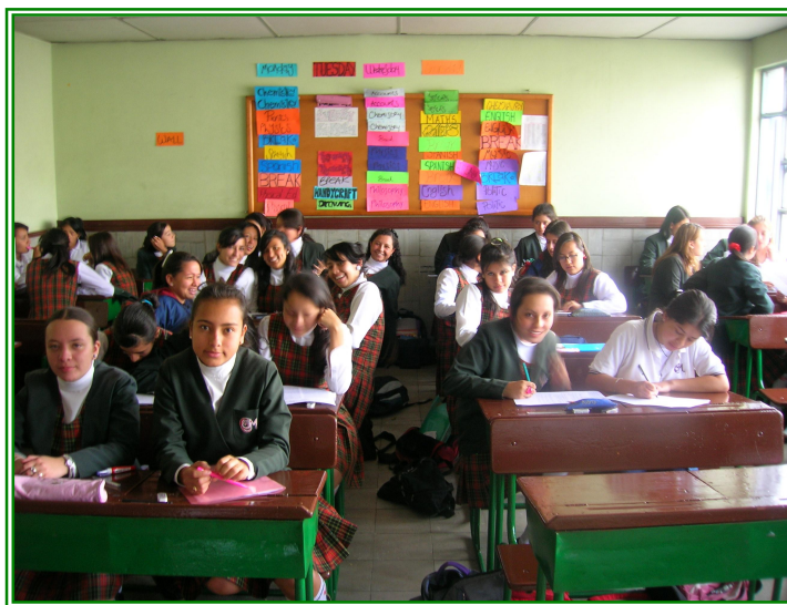
Foto 4. Estudiantes de Bachillerato clase de Educación Religiosa, Gimnasio del Corazón de María

El carácter evangelizador de la Educación Religiosa escolar se manifiesta en el hecho de que está articulada con los fines y objetivos de la educación cristiana y contribuye al logro de los mismos por parte de los educandos” 28 .