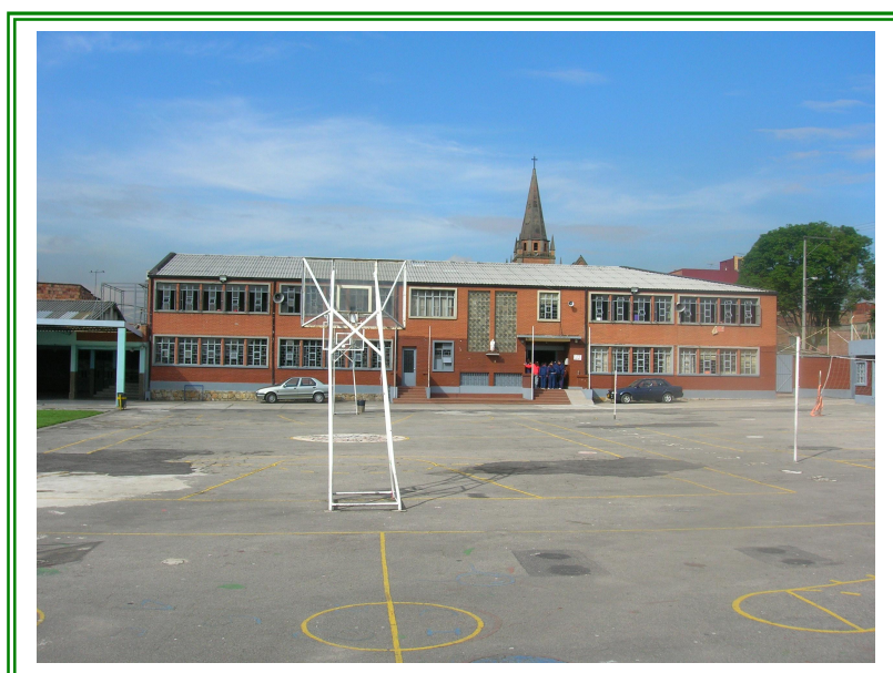
Foto 1. Panorámica del Gimnasio del corazón de María, localidad San Fernando Barrios Unidos, Bogotá, D.C.