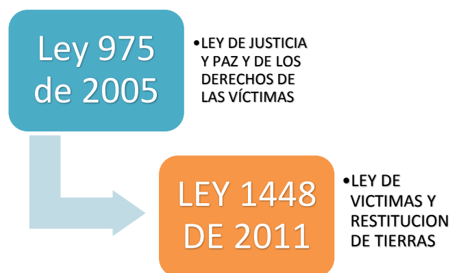
Grafica 3. Relaciones Jurisdiccionales hacia la Paz y la Reparación a Víctimas