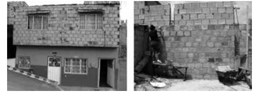
Foto 1. Vivienda informal en sectores vulnerables de Bogotá

Con el fin de hacer evidente el proceso de evolución de los cursos ofrecidos por Swisscontact, se presenta en la tabla 5, a modo de ejemplo, una descripción sintética de uno de los impartidos en la primera fase del componente de desarrollo de capacidades en alianza con el Sena.