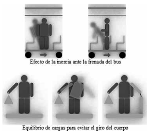
Figura 1. Ejemplos de analogías para facilitar la apropiación de conocimiento