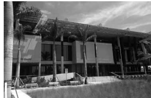
Foto 1. Pérez Art Museum Miami, Estados Unidos. Diseñado por Herzog y De Meuron* * El diseño de Herzog y De Meuron para el Pérez Art Museum of Miami, con su expresividad volumétrica, con elementos cúbicos que dan la apariencia de estar flotando, bajo un gran plano horizontal delgado y protector, se asemeja a una hoja de papel liviano.

Zevi (1999) hace hincapié en la importancia que supone el despojarse de las ideas anteriores y los tabúes culturales, de las normas de la arquitectura moderna. Al negar y anular todo