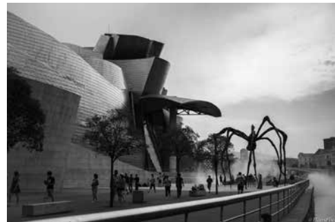
Foto 3. Museo Guggenheim, Bilbao, 1997. Diseñado por Frank Gehry

Podemos comparar la rapidez intelectual a la que se refiere Calvino (1992) cuando dice que la rapidez de estilo y de pensamiento es la segunda cualidad que debe poseer la literatura, haciendo referencia a su predilección por los textos breves en los cuales la imaginación poética y narrativa está contenida en pocas páginas, con los espacios actuales diseñados por Rem Koolhaas, quien busca una organización coherente y de gran fluidez en sus sistemas de relaciones verticales para, de esa manera, llegar a los lugares de socialización, como sucede en la biblioteca de Seattle, donde se logra apreciar la espacialidad y la vertiginosa rapidez de las escaleras eléctricas que conducen hacia los grandes espacios de reunión. Koolhaas ve los edificios como campos de espacios, donde la vida social es concebida. En otras palabras, busca condensar lo social en el espacio