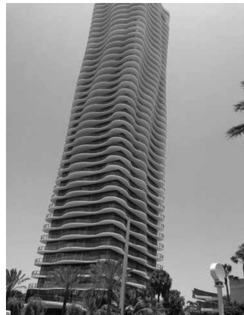
Foto 2. Edificio Regalia, Miami, Estados Unidos, diseñado por Carlos Ott* * El edificio Regalia es un claro ejemplo del lenguaje de la arquitectura contemporánea; su estética exterior y su espacio interior pretenden estimular los sentidos al tratar de comunicar movimiento y fluidez por medio de elementos delgados que dan la apariencia de que esté ondulado.