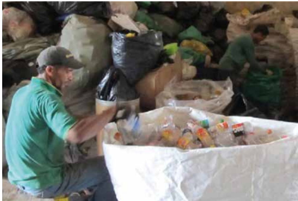
Figura 2. Selección y clasificación de los materiales reciclables