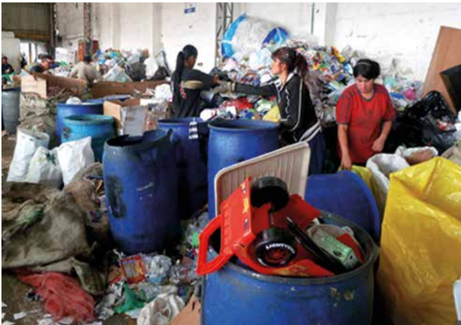
Figura 1. Recepción y almacenamiento de elementos reciclables