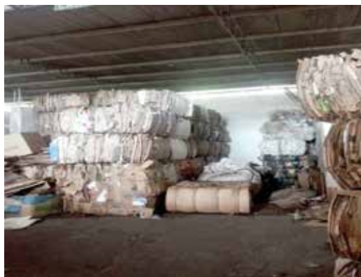
Figura 3. Almacenamiento de elementos reciclables para su posterior distribución