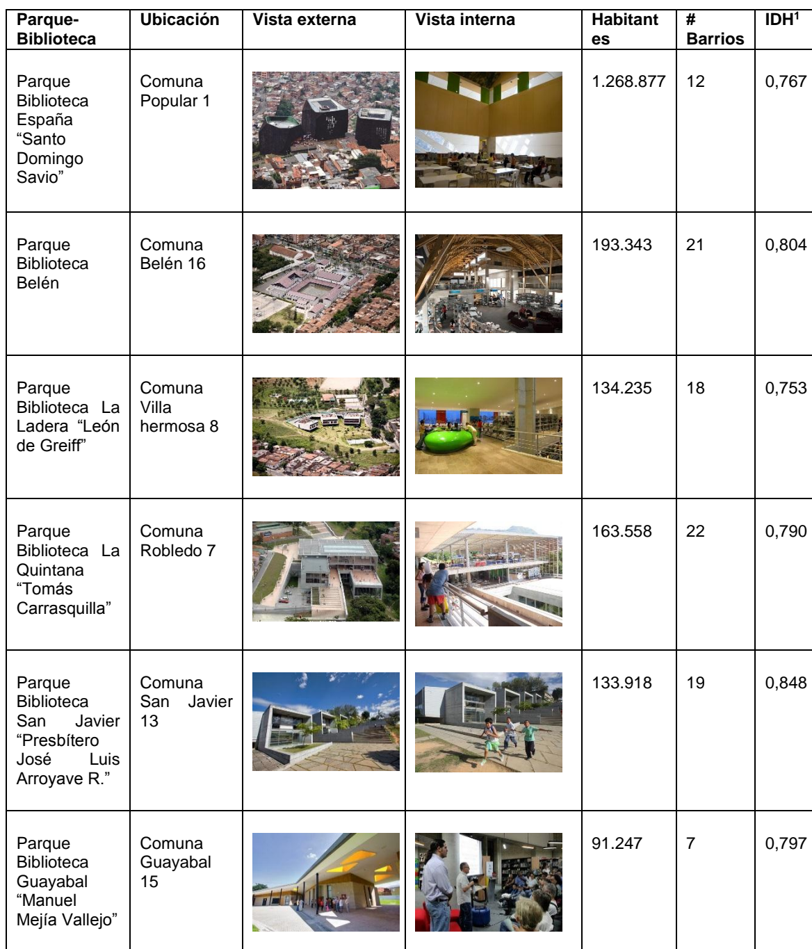
Tabla 2. Parques-Biblioteca Medellín.