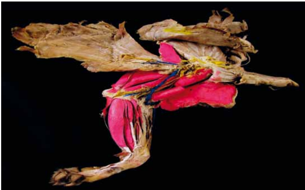
Figura 5. Miembro anterior izquierdo (canino)