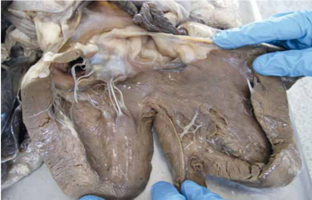
Figura 4. Corazón de equino