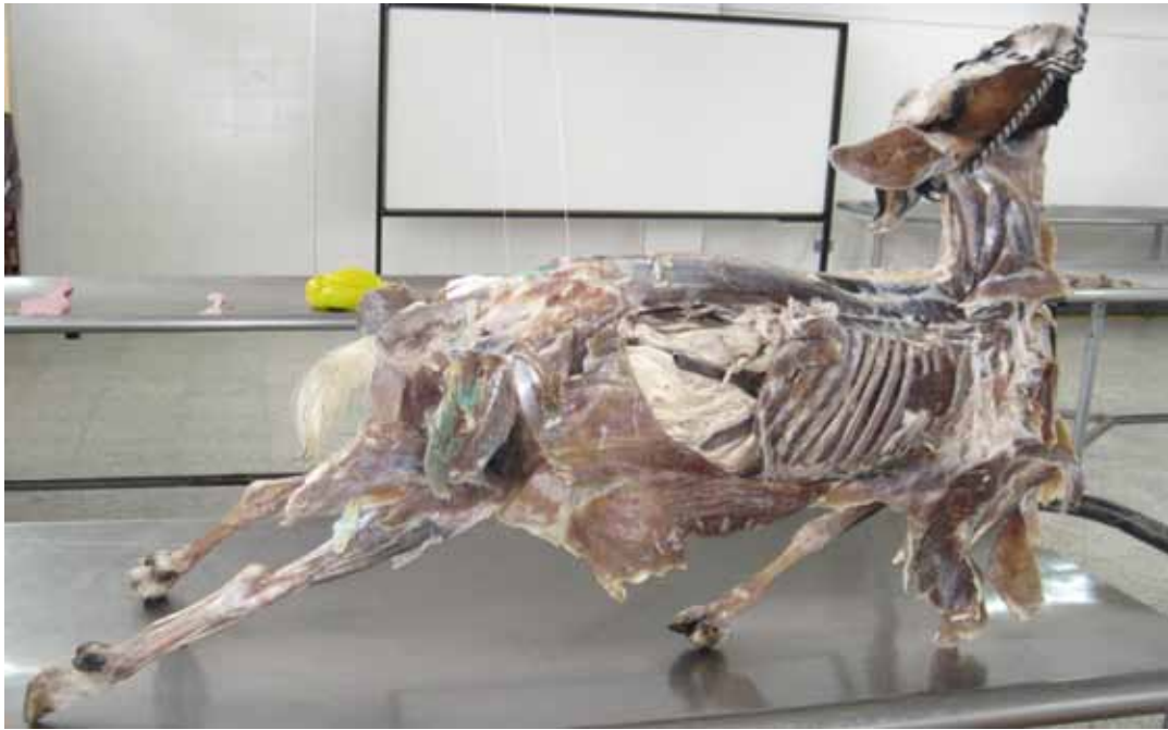
Figura 2. Región del cuello, tórax, cavidad abdominal y miembros (caprino)