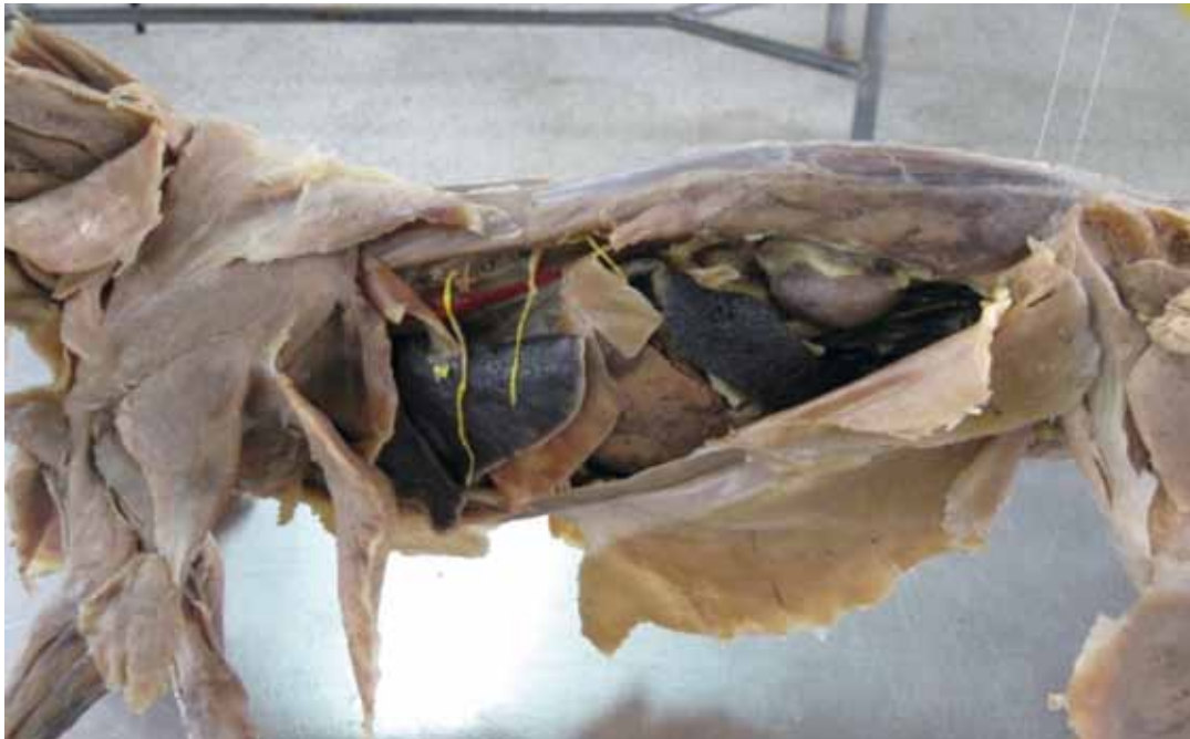
Figura 3. Topografía abdominal y torácica (canino)