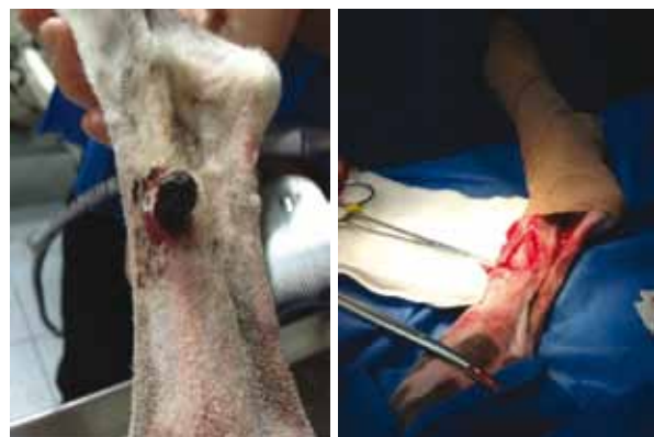
Figura 2. a) HSA cutáneo para extraer quirúrgicamente; b) apreciación de los bordes de la lesión luego de la extracción quirúrgica

Luego de la cirugía se volvieron a realizar exámenes complementarios: hemograma (tabla 4), perfil bioquímico (tabla 5), panel de coagulación (tabla 6), cultivo y citológico del fluido de la lesión. En el hemograma se encontró una leucopenia; en el perfil bioquímico, un aumento de los valores de albumina, índice A/G, bilirrubina total y directa, y, por otra parte, se halló una hipoglobulinemia. En el cultivo corriente no hubo desarrollo de gérmenes en muestra examinada y el citológico del fluido de lesión posquirúrgica resultó en un transudado puro compatible con un seroma.