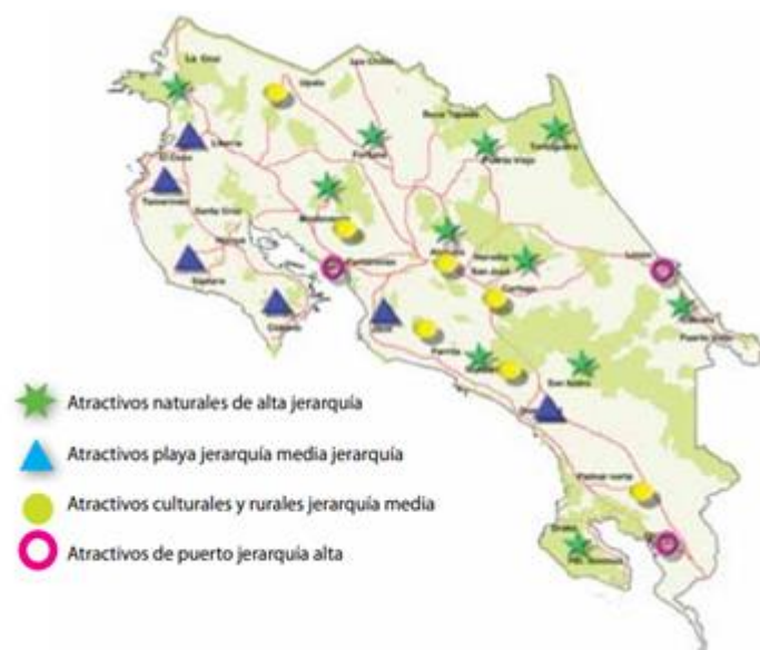
Gráfica 1. Distribución de atractivos de Costa Rica