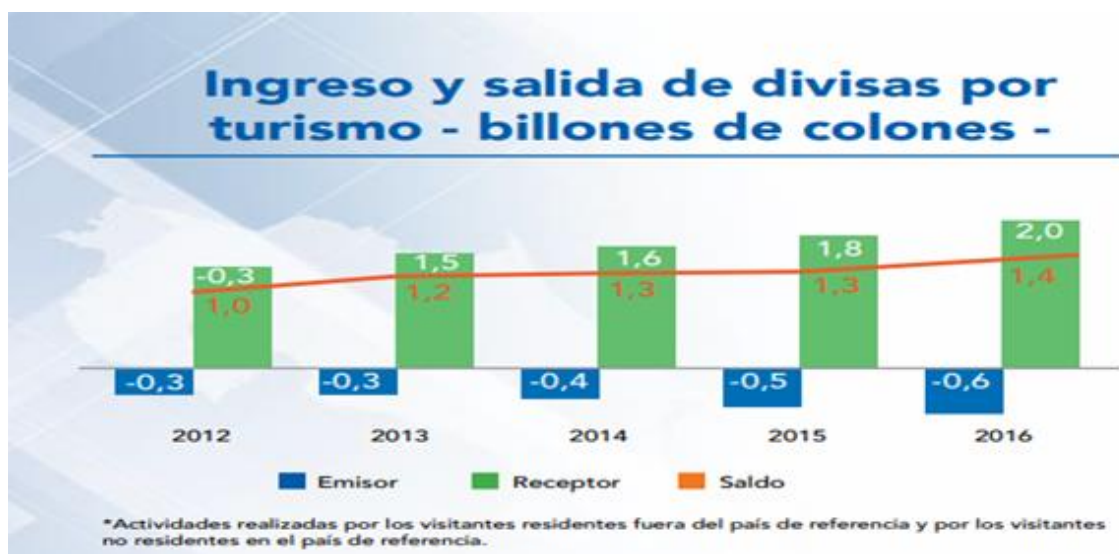
Gráfica 2. Ingreso y salida de divisas por turismo – billones de colones