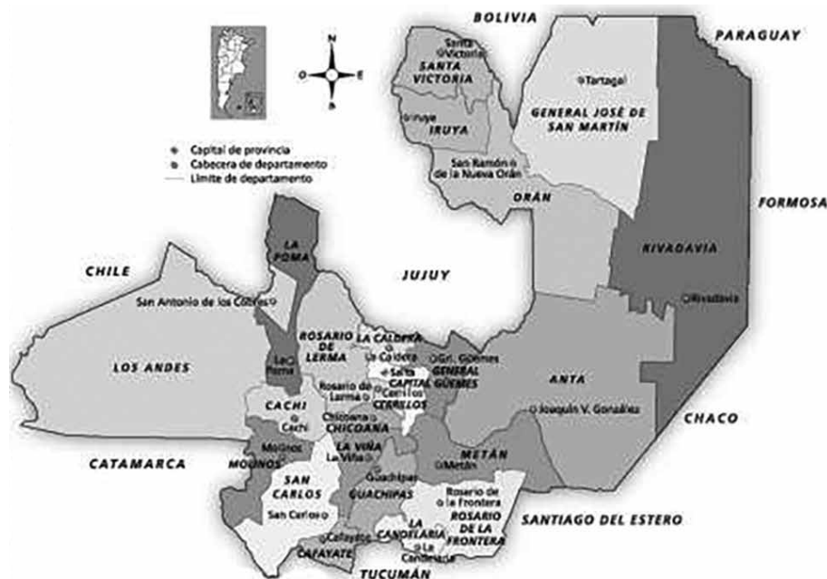
Figura 2. Departamentos que conforman la provincia de Salta y localización de las unidades educativas de nivel superior