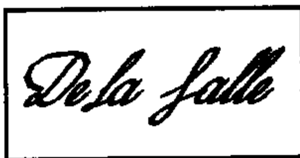
FIGURA 3. Rúbrica de Juan Bautista De La Salle

La rubrica De la Salle, recoge en un símbolo toda la espiritualidad lasallista, es decir, en esta firma se ve reflejada la impronta que identifica a una persona que ha sido formada bajo los principios lasallistas. De la Salle es el perfil, es la característica, es ese algo que permite percibir que una persona es lasallista, esté donde esté.