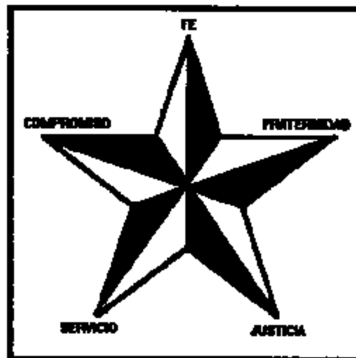
FIGURA 2. Estrella y Valores lasallistas

brazos extendidos en sentido del horizonte, se encuentran la fraternidad y el compromiso, que son valores de la alteridad, de entrega. Por último, las dos puntas restantes son las que se encuentran como base, como apoyo, cimentadas sobre la realidad y es allí donde se ubican los valores del servicio y la justicia.