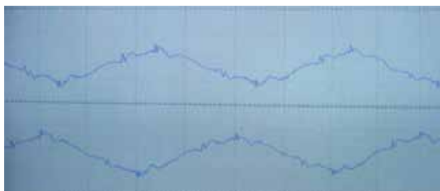
Figura 3. Trazado electromiográfico de músculo masetero con potenciales de fibrilación