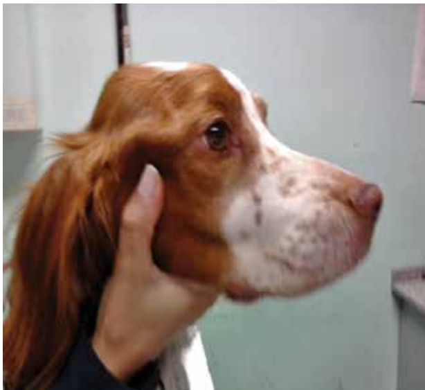
Figura 1. Bretón con severa atrofia muscular bilateral y simétrica de los músculos temporales y maseteros