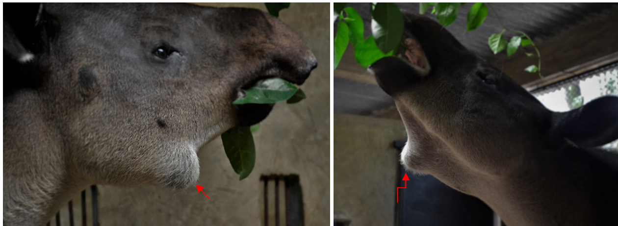
Figura 1. Inflamación mandibular (flechas rojas)

Se han presentado cinco casos de inflamación mandibular en tapires juveniles (menores a cuatro años) cautivos en dos colecciones (Club Auto Safari Chapín, Guatemala y Furesa, El Salvador). Pese a ser una patología comúnmente vista en este género, se desconoce su patogénesis. La inflamación inicia como una pequeña masa en la rama mandibular, que luego llega a ser tan grande como el tamaño de una manzana (figuras 1 y 2). Por lo general los animales afectados no pierden el apetito y la ingesta alimenticia no se ve afectada. No hay salivación y, en algunas ocasiones, se percibe un ligero mal olor al examen bucal. Inicialmente la consistencia de la lesión es blanda, pero, con el paso de los días, esta se torna de consistencia firme y libre de dolor. En un caso se presentó fístula dental con secreción de material purulento, blanquecino y ligero mal olor, debido a contaminantes secundarios, y para ello se requirió el uso de antibiótico (amoxicilina 20 mg/kg, vía oral). Sin embargo, los otros casos manifestaron únicamente la inflamación del área. De los cinco casos, solo en uno se realizó cultivo bacteriano, el cual fue tomado del área de severa inflamación y el resultado fue negativo.