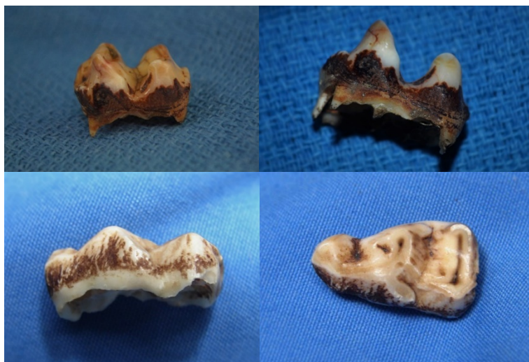
Figura 3. Coronas recolectadas de diferentes ejemplares

Alrededor de 15 días después de iniciada la inflamación, por lo general, los animales botan la tapa dental (corona) del premolar caduco (figura 3). Fisiológicamente procede que, a medida que los dientes permanentes en desarrollo se dirigen hacia la superficie, presionan las raíces de los dientes deciduos, cortando su nutrición de forma gradual. Las coronas “caps” se aflojan y, al final, mueren, lo que permite la erupción del diente permanente; por ende, la inflamación cede y se torna normal. Radiológicamente el proceso se aprecia en la figura (4 y 4a).