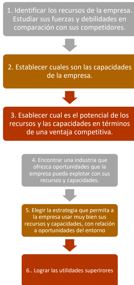
Figura 2. Modelo de recursos para lograr utilidades