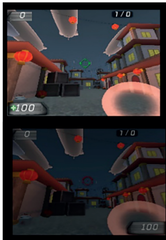
FIGURA 3. Principio biocular aplicado a un videojuego de acción, Magical Garden Game World

a desarrollar mecanismos con un enfoque binocular como alternativa para tratar la ambliopía, y se propone la implementación de películas o videojuegos utilizando este principio (48).