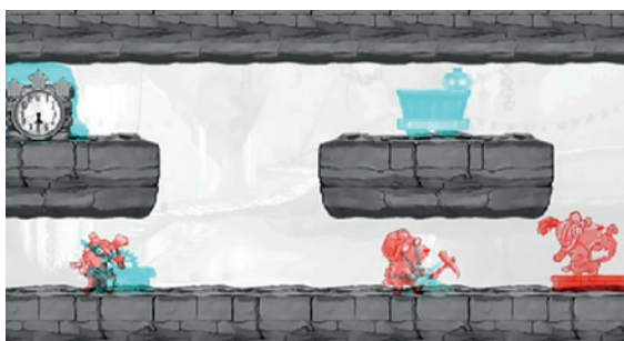
FIGURA 2. Dig Rush, un videojuego creado con el principio del tratamiento interactivo binocular

también lograr un impacto sobre la calidad de la imagen y la visión binocular y facilitar la adherencia al tratamiento, una problemática presente en la oclusión (39,40). El enfoque binocular pretende obtener, a través de la estimulación de ambos ojos, un efecto secundario sobre la agudeza visual, al eliminar la supresión interocular y permitir la fusión (41). Hess y Thompson describen una serie de tratamientos que permiten la participación del ojo dominante en la terapia (41); es el caso de un tratamiento interactivo binocular (figura 2), también llamado iBit System (42-44). Otra propuesta es el protocolo de aprendizaje perceptual denominado Push-Pull (45) y un enfoque de juego de acción creado por Noah (46).