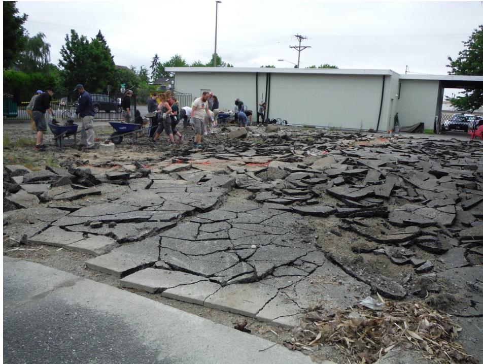
Figura 2. Remoción de pavimento del programa Devape en Oregón, EE, UU.

cual se promueve la remoción de pavimento innecesaria en zonas urbanas para crear nuevos espacios verdes permeables que beneficien el manejo del agua de manera natural, y brinden más espacios de esparcimiento a los ciudadanos.