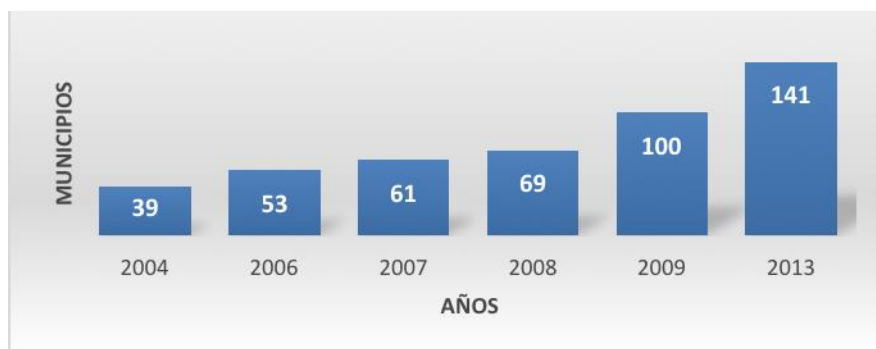
Figura 4. Desarrollo de la consolidación

evidenciar al no encontrar alguno de estos que hubiera salido de la intervención del Estado desde que se dio inicio a esta estrategia (figura 4).