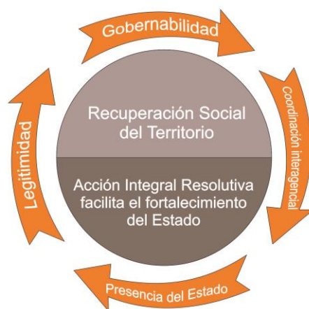
Figura 2. Acción integral resolutiva