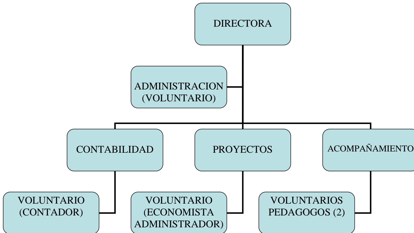
Organigrama - Nivel Jerárquico y de Relaciones con el Voluntariado