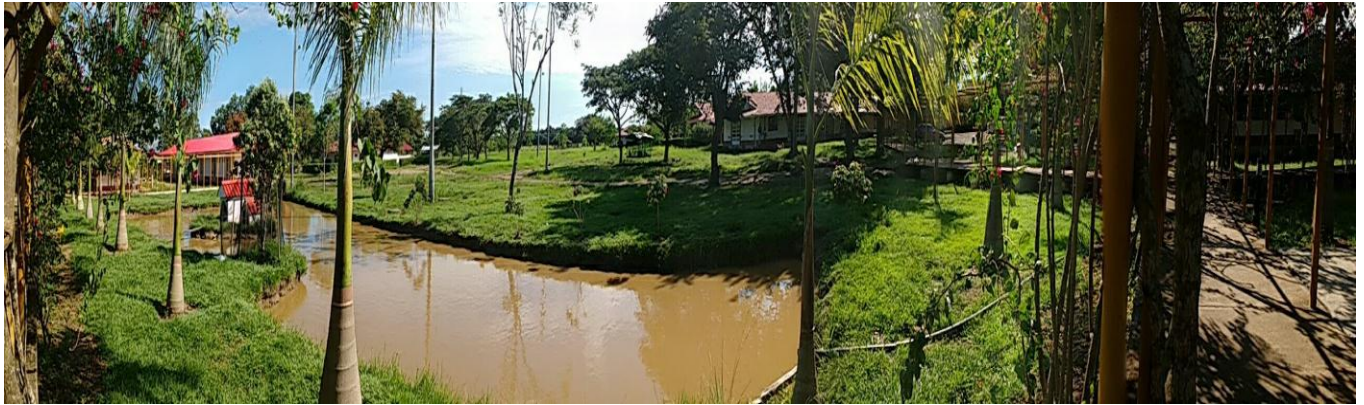
Figura 1. Panorámica campus Universidad de Salle-Utopía en Yopal, Casanare.

A 12 km de la capital del departamento del Casanare, se encuentra ubicado este Campus denominado Laboratorio de paz, donde se lleva a cabo el Proyecto Utopía de la Universidad de La Salle. Iniciativa que desde el 24 de mayo del 2010 abrió sus puertas, para transformar la vida de jóvenes campesinos víctimas del conflicto armado.