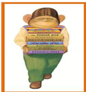
Figura 2. Ilustración de Anthony Browne.

Se expondrán una serie de pasos que te permitirán acercarte al concepto de libro álbum. En este sentido, es necesario leer atentamente cada una de las definiciones o sugerencias expuestas dentro de los pasos, de manera que con el desarrollo de cada uno de estos te sea posible comprender el sentido del libro álbum y la oportunidad de trabajarlo en el aula.