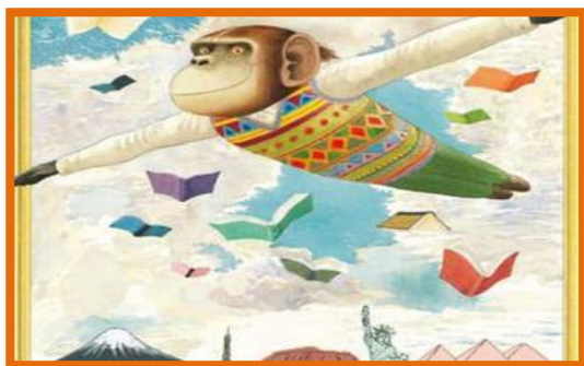
Figura 1. Ilustración de Anthony Browne