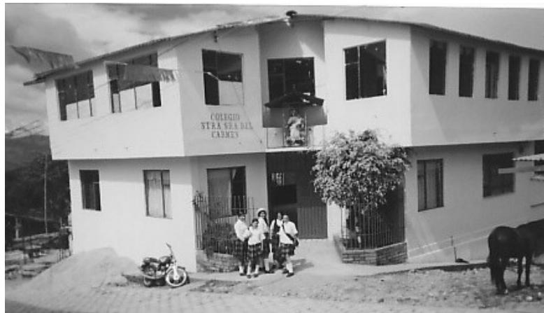
Figura 2. Fachada de la Institución Educativa Nuestra Señora del Carmen.

para eventos culturales, recreativos, escolares y comunitarios, el nombramiento a nivel departamental del personal docente y administrativo, y lo más trascendental fue la conformación de una sola institución Educativa denominada “NUESTRA SEÑORA DEL CARMEN”, integrada por el colegio Nuestra Señora del Carmen, y la escuela Rural Mixta Nuestra señora del Carmen, bajo una sola administración, que ofrece el servicio educativo en los niveles preescolar, Básica primaria, Básica secundaria y media vocacional.