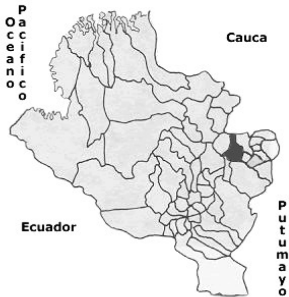
Figura 1. Ubicación del municipio de San Lorenzo en el departamento de Nariño.

Posee tres vías de acceso una de ellas permite el ingreso directo vía panamericana, cabecera municipal de San Lorenzo y Corregimiento de El Carmen; Una segunda vía de acceso desde la capital del departamento así: Pasto, Buesaco, La Unión y Corregimiento de El Carmen. Siendo la segunda ruta la más utilizada por la facilidad en el transporte. El promedio de tiempo entre el municipio de Pasto y el Corregimiento del Carmen es de cuatro horas y media. De los 105 kilómetros de recorrido un 70% corresponde a vía destapada lo cual dificulta el acceso, para los habitantes que deben realizar distintas actividades asociadas a su trabajo, estudio, salud, entre otras.