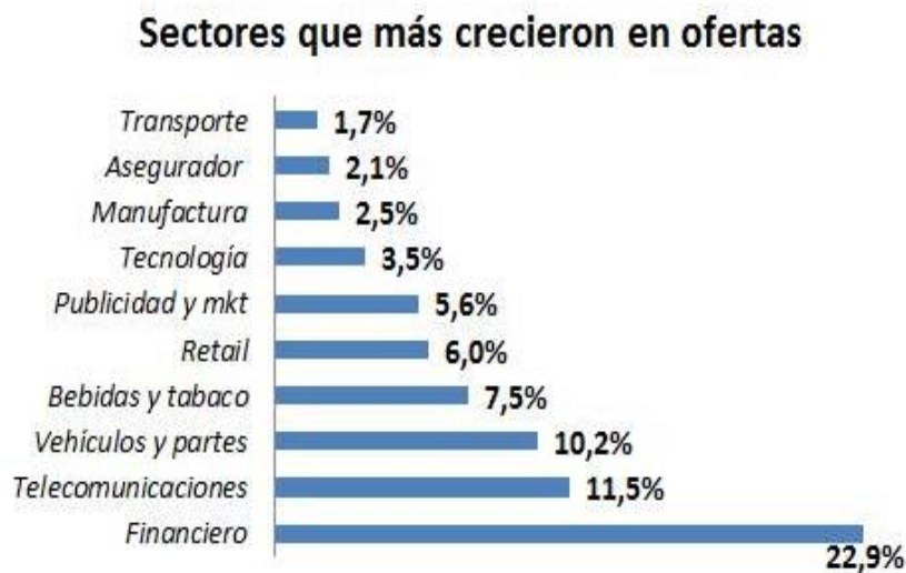
Gráfica 2. Sectores con mayor crecimiento de ofertas laborales A febrero de 2017