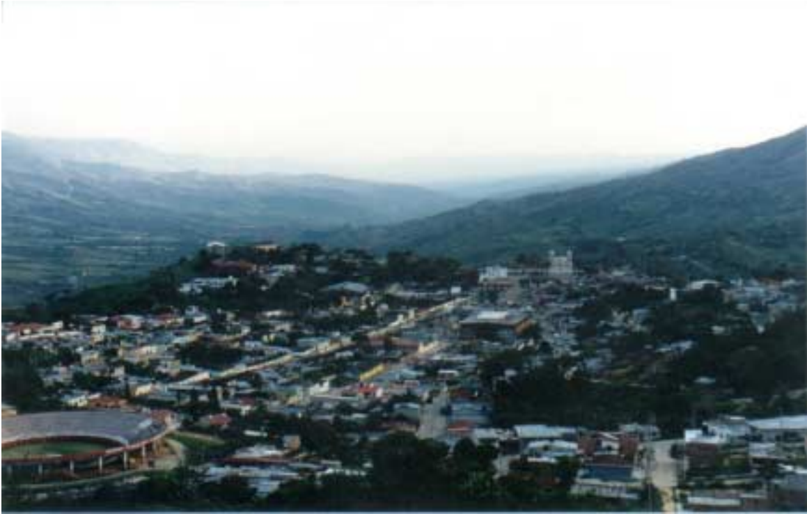
PANORÁMICA DE SAN JUAN DE RIOSECO