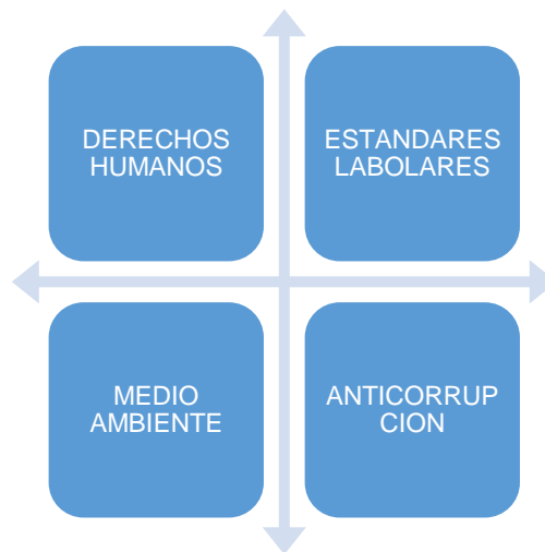
Ilustración 2 Áreas Clave del Pacto Mundial