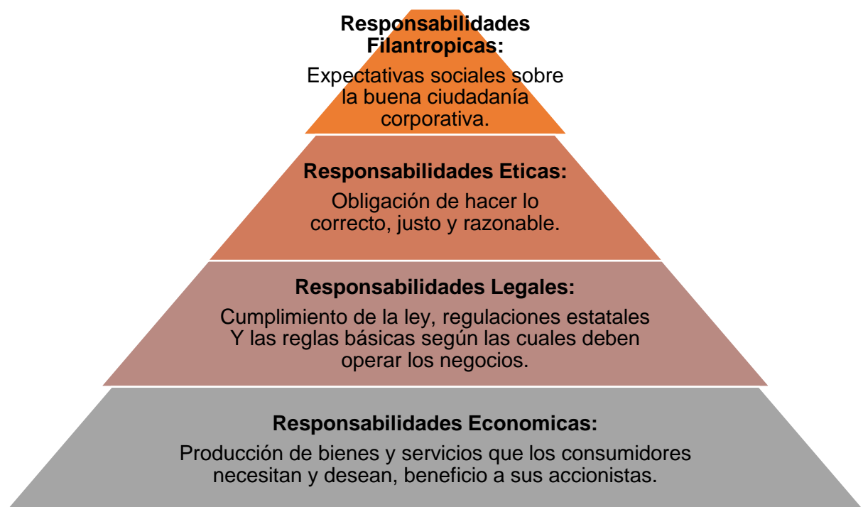
Ilustración 1 Pirámide de la RSE

Fuente: Elaboración propia. Basado en: Carroll (1991)