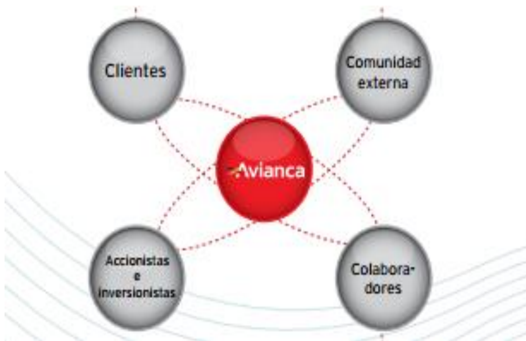
Ilustración 4 Grupos de Interés Avianca