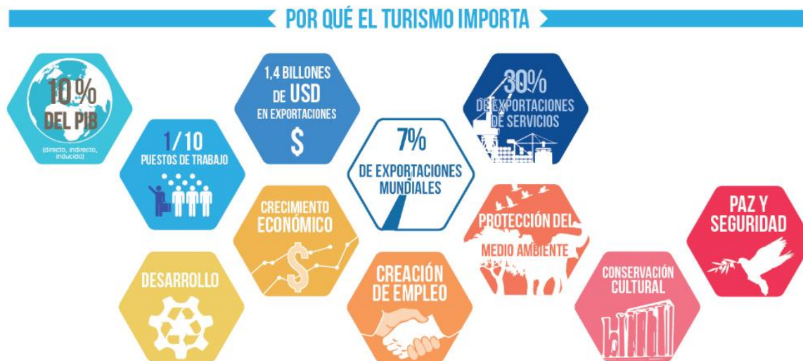
Figura 1. Principales ventajas del turismo.