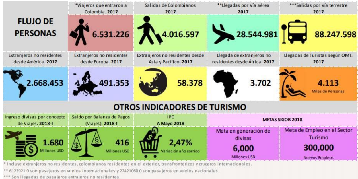
Figura 5. Datos estadísticos turismo en Colombia