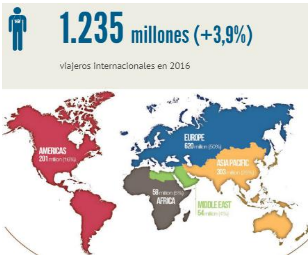
Figura 2. Ingresos por el turismo a nivel mundial.

Así mismo, la OMT prevé para un futuro, proyectando datos para el año 2030, como el turismo se irá expandiendo y diversificando a nivel mundial y beneficiará a las economías emergentes, las cuales, según sus proyecciones duplicaran los porcentajes de los países con economías avanzadas.