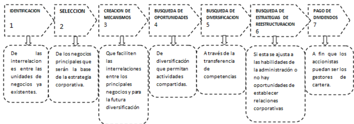
Gráfico 1: Pasos para la implementación exitosa de una estrategia