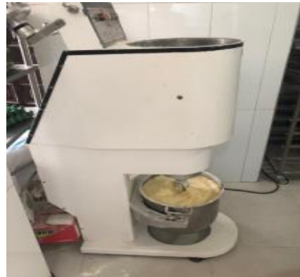
(Bogotá D.C. 2018)