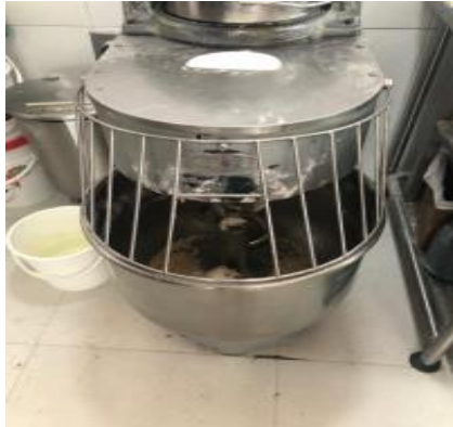
Ilustraciones 3 y 4

Cuando se requiere hacer algún producto, se hace la distribución de las materias primas requeridas y el pesaje respectivo. Una vez se cuenta con lo requerido se procede a mezclar y amasar los productos en los equipos de la panadería.