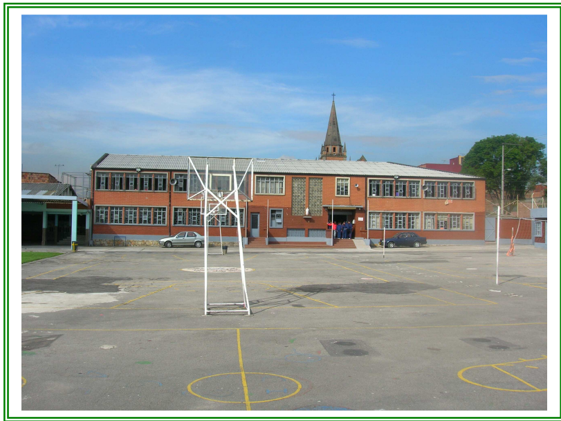
Foto 1. Panorámica del Gimnasio del corazón de María, localidad San Fernando Barrios Unidos, Bogotá, D.C.