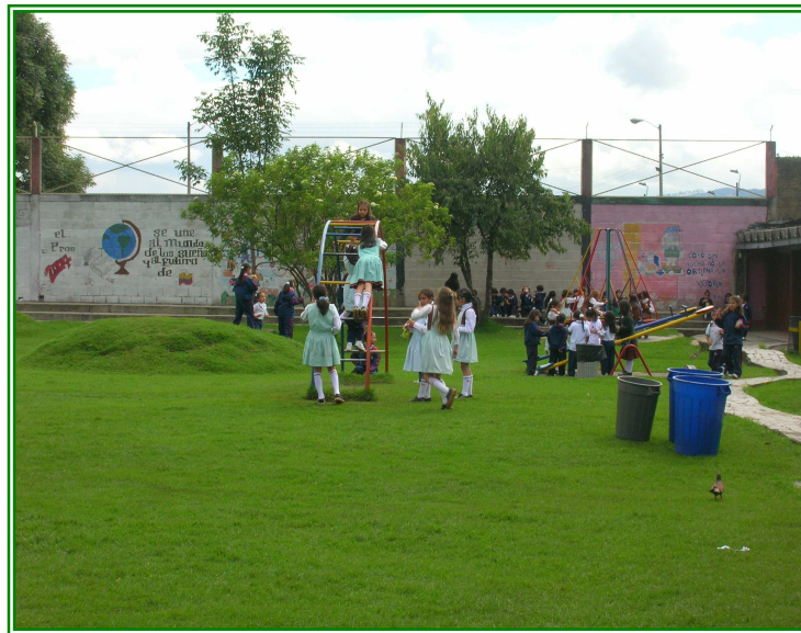
Foto 5. Momento de recreación niñas Primaria, Gimnasio del Corazón de María

En esta categoría no se encontró documento alguno referido o dedicado a este aspecto.