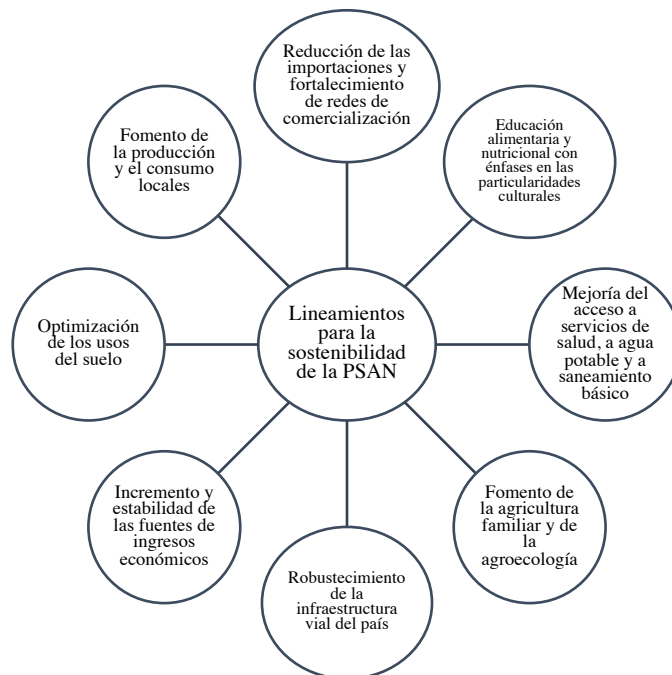
Figura 1. Lineamientos para la sostenibilidad de la PSAN