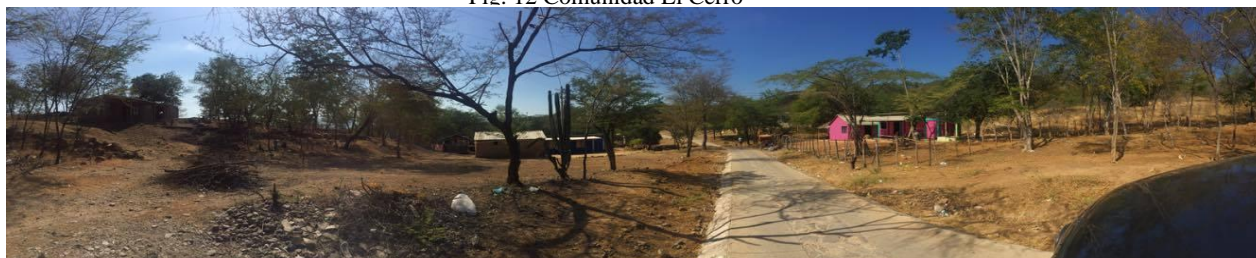
Fig. 12 Comunidad El Cerro

Cuando el presidente Juan Manuel Santos comenzó su gobierno, se modificaron las leyes de regalías. Anteriormente las comunidades indígenas que estuvieran a menos de 5 km de la explotación de carbón, tenían el derecho al 20% de los recursos destinados al municipio, de esta manera, todos los proyectos y necesidades se presentaban ante los alcaldes y contratistas, sin embargo, la calidad de la infraestructura no reflejaba las inversiones reportadas para su mejoramiento. Se hizo entonces un sistema general de regalías por el presidente, en donde sin importar la distancia de las comunidades a las actividades mineras, recibirían el 3% de los recursos del municipio, estos recursos en presupuesto son invertidos en tecnología e infraestructura, pero lo observado en la región no es reflejo de que se haya realizado inversiones que generen desarrollo, o un mínimo mejoramiento en la calidad de vida de las comunidades, pues éstas se mantienen en condiciones de escasez de agua, sin tierras productivas, pues el Cerrejón se apropió de toda la riqueza de la zona dejando tierras estériles. El sentir general de la población y lo evidenciado en las entrevistas, es que esta tierra ha vivido corrupción, tanto del Estado como de las empresas.