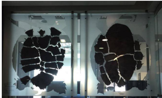
Fig. 18 Oficinas Cerrejón Bogotá

En sus inicios la empresa comenzó con mitad capital extranjero (Exxon) y la otra mitad empresa gobierno colombiano, esta era una época en donde no existían los conceptos de Responsabilidad Social Corporativa ni de derechos humanos, como existen hoy en día: Lo que básicamente existía en esa época era ser un buen vecino de las comunidades y actuar bajo la ley; estas fueron las bases que la empresa abordó para relacionarse con las comunidades del área de influencia; no habían legislaciones muy detalladas sobre esto y no habían unas obligaciones muy específicas, La gestión social se dirigía principalmente a mantener una relación amigable