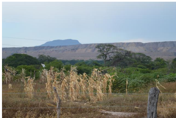
Fig. 16 Vista de los botaderos de El Cerrejón desde la comunidad de San Francisco

A esta comunidad, no les han propuesto reubicación, el Cerrejón realizó un estudio hace seis años aproximadamente, no obstante la comunidad fue renuente con la compañía y no siguieron procedieron con planes de cambio, según el líder de la comunidad “estas visitas no eran para ofrecer ayuda sino para usar el territorio para explotación”. Reportan que no les han hecho visitas médicas y tampoco han recibido dotaciones.