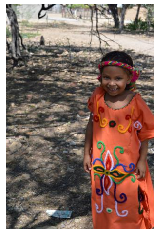
Fig. 9 Niña Wayúu perteneciente a la comunidad Guamachito