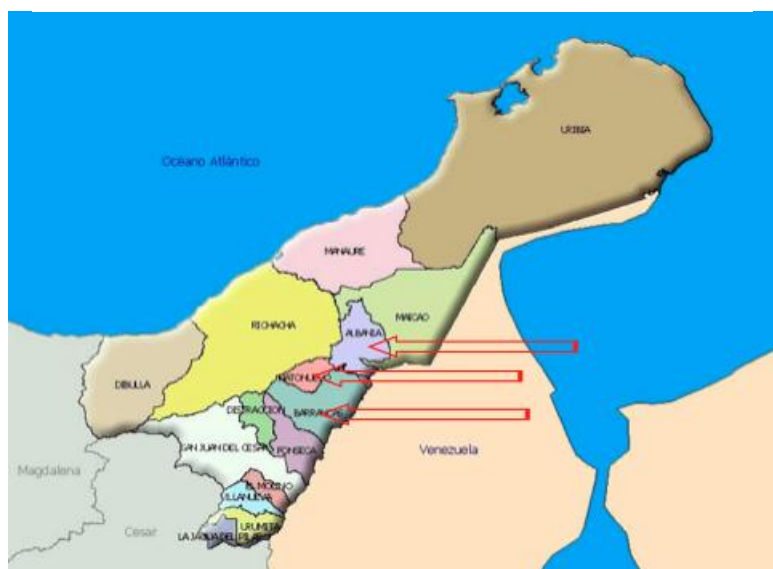
Fig. 2 Localización de los Municipios de Albania, Hatonuevo y Barancas