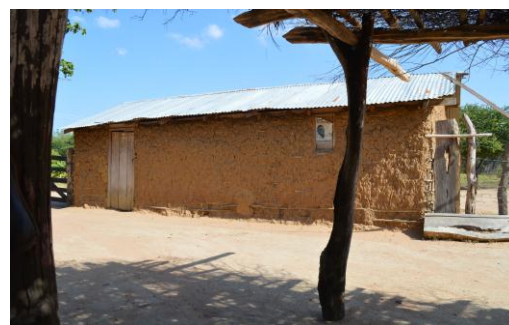
Fig. 3: Casa en Ranchería Ware Ware

Inicialmente, la ranchería de Ware Ware, ubicada al norte de la zona de operaciones mineras; en esta ranchería la dirección del viento es en sentido norte a sur, lo cual permitiría interpretar que el aire que llega a esta comunidad se encuentra libre de partículas producto de la minería. Sin embargo, se encuentran otros tipos de inconvenientes; la población se ve completamente afectada por la problemática del agua; la empresa El Cerrejón ha dejado a un lado a la comunidad y a pesar de que no son afectados por los vientos de la minería, el arroyo Bruno que es su principal fuente hídrica está contaminado por el proceso minero, los habitantes y animales de esta población ya no pueden usar esta agua para su consumo, ya que esta fuente ha venido recogiendo y transportando desechos del complejo minero. Precisamente sobre la problemática del agua, una circunstancia preocupante es el desvío de dicho arroyo, realizado por la empresa minera con el fin de explotar el carbón del subsuelo. Sobre este hecho, la empresa el Cerrejón afirma que a pesar de la modificación del cauce del arroyo, éste se comporta igual que antes.