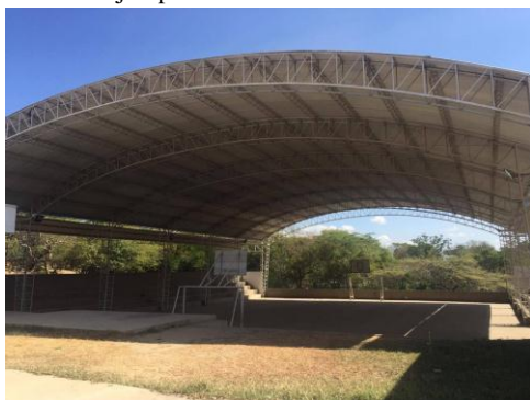
Fig. 10 Centro deportivo construido por El Cerrejón para la comunidad de El Cerro

Después del relato de las comunidades, aproximadamente a 10kms de la población Guamachito, se encuentra la población indígena de El Cerro, esta población tiene una incidencia directamente negativa por la dirección de los vientos.