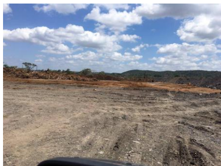
Fig. 17 Inicio de las operaciones de remoción de la capa vegetal o suelo fértil que se deposita en bancos para luego rehabilitar la áreas intervenidas por la minería

En primer lugar se contaba con el departamento de La Mina atendía todos los temas específicos que se daban entre Albania, Hato Nuevo y Barrancas. En segundo lugar estaba el departamento de La supervisión de Puerto Bolívar que se encargaba de los temas de los cuatro sectores que tiene la línea férrea, y de las comunidades vecinas de Media Luna, en tercer lugar, también estaba el departamento de Reasentamientos y programas sociales encargados comunidades como lo han sido: Oreganal, Tabaco y Los remedios, aunque este último no fue un reasentamiento, es vecino de la operación minera y los programas sociales los incluyen en todas los temas de educación, salud, deportes y cultura.