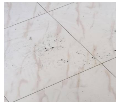
Fig. 14 Polvillo de carbón en escuela de la comunidad El Cerro