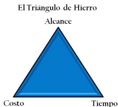
Ilustración 1. Triangulo de Hierro, extraído de Gestión y evaluación de proyectos.