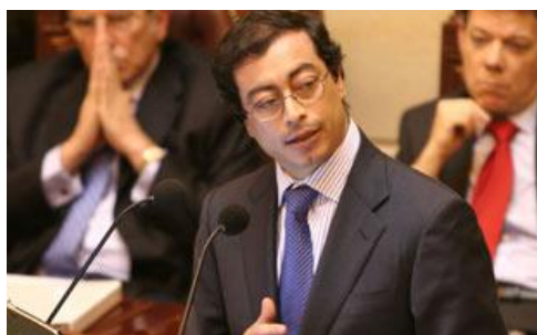
Imagen 1. El senador de izquierda Gustavo Petro presentando su denuncia sobre el narcoparamilitarismos en Antioquia, durante el periodo en que Álvaro Uribe era gobernador

Esto fue lo que suscitó el discurso pronunciado por Petro sobre el departamento de Sucre, el cual estuvo orientado a argumentar que una de las causas del gran conflicto de Colombia es el trance entre el Estado de derecho y los poderes mafiosos locales, entendidos estos últimos como fusiones entre élites económicas, dirigentes políticos y delincuentes convertidos en comandantes manejando ejércitos privados. Esa fusión tiene como propósito el control social dictatorial por la vía de la masacre y el terror para el enriquecimiento ilícito, la depredación, la captación de los recursos públicos y los recursos naturales. Esto originó, por ejemplo, la masacre de Macapeyo, donde 15 campesinos fueron asesinados por paramilitares, el 16 de octubre de 2000. Petro mostró grabaciones que involucraban al senador de la República Álvaro García Romero. Terminaba Petro preguntando: “(...) un proceso de estos, en que se acusa a un senador con unos instrumentos de investigación públicos, de la justicia colombiana, cómo es que el fiscal general, el señor Camilo Osorio, sabiendo que está sindicado el senador de paramilitarismo, ni más ni menos, de asesinatos, de concierto para delinquir, de mafia, nombra a la sobrina como secretaria general de la Fiscalía. Explíquenme: ¿En qué país vivimos?”. Como en las ocasiones anteriores, Petro en principio fue demandado por los políticos aludidos y terminó aislado en el Congreso producto de su trabajo (Revista Semana, 02/02/2007).