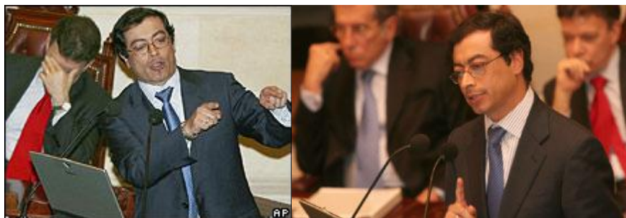
Imagen 2. El senador Gustavo Petro lanzando acusaciones contra el presidente Uribe

Pero fue hasta comienzos de 2007, cuando el destape de la parapolítica tuvo su más álgido encumbramiento, con el tema de Antioquia , centrado en los hechos de violencia ejecutados por las AUC con el consentimiento de órganos de las Fuerzas Militares y los políticos de ese departamento. Y es que, justamente, en Antioquia, uno de los enclaves del paramilitarismo en el país, comenzó su carrera política el actual presidente, Álvaro Uribe Vélez. Varias veces Uribe y Petro han discutido en público como consecuencia de las pesquisas del legislador. Ocurrió, por ejemplo, cuando el senador dijo en un debate que un hermano del Jefe de Estado fue investigado por paramilitarismo. Como es sabido por la opinión pública, Uribe negó en principio dicha afirmación, pero al cabo de dos años terminó reconociéndola, en diciembre de 2006, justo cuando Petro anunció que haría un debate sobre la 'parapolítica' en Antioquia. En febrero de 2007, el congresista afirmaba: “Hay pruebas de que los primos del presidente también tuvieron nexos con los paras y por esta razón Uribe le debe una explicación al país. Él está pidiendo que todos los que tengan nexos con el paramilitarismo lo digan públicamente, así que tiene que empezar por reconocer que su familia está implicada”, mientras el país se enteraba que la familia del señor Petro recibía amenazas de muerte por causa de estas investigaciones sobre Antioquia.