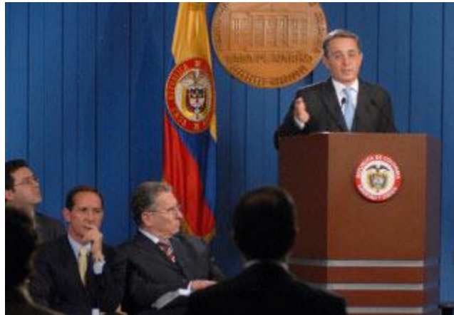
Imagen 4. El presidente Uribe convocó una rueda de prensa para desvirtuar las acusaciones del senador Petro. Se transmitió en todas las cadenas de televisión y en algunas emisoras de radio. No invitaron periodistas de SEMANA ni de 'El Tiempo'

Después de 48 horas de silencio, a las 9:30 pm, en la casa de Nariño, Álvaro Uribe dio declaraciones a un puñado de periodistas (excluyendo a los de el Tiempo y Semana ), motivado por la decisión del ex vicepresidente Al Gore de cancelar su participación en un foro en Miami del sábado 21 de abril, porque dijo que después de enterarse de los debates en su contra y en contra de su familia no quería estar al lado del Presidente Uribe. Su intervención duró 105 minutos y fue transmitida por radio y todos los canales de TV. Allí habló de todas las cuestiones que planteó Petro dos días antes.