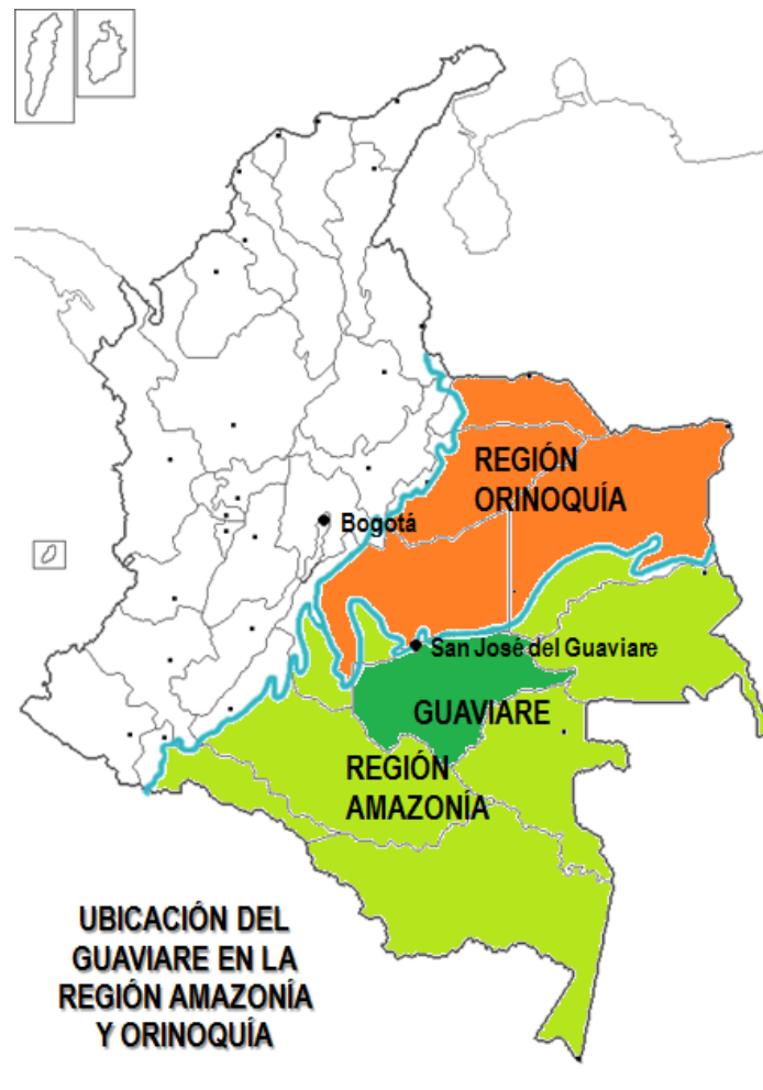
Mapa 1 Ubicación del Guaviare en las regiones naturales de la Orinoquía y Amazonía

zonas de frontera, lo que ha llevado a que las políticas públicas no sean funcionales y que el Estado sea inoperante en medio de ese orden social; el Gobierno Nacional no reconoce la historia, geografía, diversidad y rasgos culturales de cada zona, impone los lineamientos nacionales e incluso globales, con políticas e instituciones desde el centro del país para resolver los problemas que se profundizan por la falta de una adecuada presencia institucional que corresponda a las necesidades del territorio. Las fronteras son sitios de olvido, en donde se evidencia la frágil articulación de la sociedad con las políticas de Estado. De esta manera en el Guaviare, en la etapa de postconflicto donde no existen políticas públicas idóneas en cultura y en educación, es posible que se perpetúen las condiciones de un territorio de frontera y se distancie de cualquier forma de desarrollo.