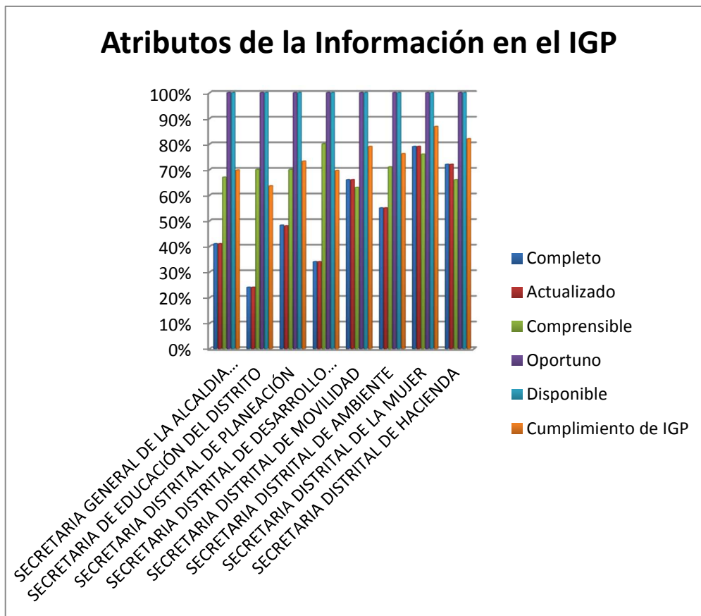
Tabla 4. Análisis de la matriz de acuerdo con los atributos del IGP.